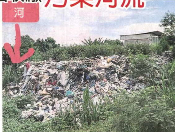
河边的垃圾常常掉入河道。

(加影27日讯)皇冠城乌冷河边非法回收厂垃圾堆积如山,每逢大雨垃圾冲入河道,存污染河水隐忧,执法单位拉大队查封工厂! 雪州行政议员许来贤今早率领雪州水务管理机构、市议会和土地局等单位执法员,突击一家位于皇冠城冷岳河边的非法工厂,这家工厂在河边回收垃圾和烂铁已长达8年。 许来贤说,市议会在8月曾取缔该工厂一次,不料业者还是继续收烂铁,他不排除有市议会官员包庇业者,他已指示有关当局调查。 根据现场所见,这家回收厂内垃圾堆积如山,而且就在河边,每逢下大雨都有垃圾被冲入河道。