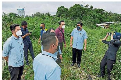
↑许来贤(右二)与土地局、环境局及雪州水供管理机构官员,视察占用保留地的非法回收厂如何处理固体垃圾。

雪州行政议员兼加影州议员许来贤今早与乌冷土地局、雪州水供管理机构(LUAS)、环境局及加影市议员林金瑛,前往蕉赖皇城Mahkota Residence 1路巡视有关非法回收厂,并且进行查封。