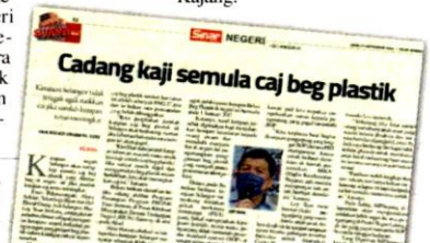
Laporan Sinar Harian pada Isnin.

"Saya setuju kerajaan negeri naikkan caj tersebut, tapi mereka perlu fikirkan cara lain bagi menunjukkan ketegasan mereka terhadap penjagaan alam sekitar," katanya yang tinggal di Kajang.