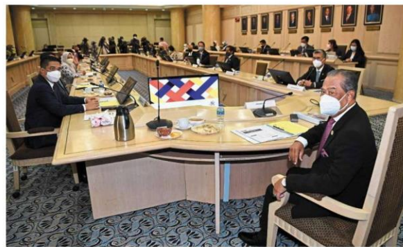
High-powered meeting: Muhyiddin is flanked by Azmin (left) and Tengku Zafrul. Also present at the NRC meeting are Khairy (next to Tengku Zafrul) and Dr Noor Hisham.

state-level NRCs be formed to ensure that recovery plans were implemented efficiently, adding that the respective mentris besar and chief ministers would chair it. He said the meeting also dis-