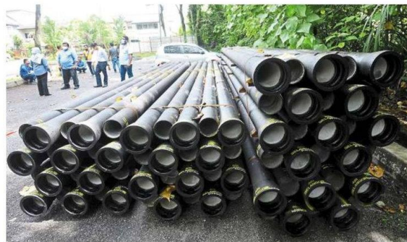
Ductile iron water pipes will be installed in Sections 12, 16 and 17 of Petaling Jaya.

The new ductile iron type will not only be larger in diameter but will also have a longer service life of between 50 and 100 years.