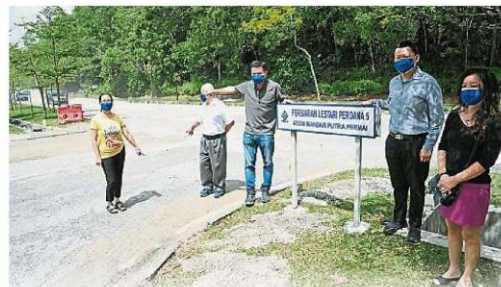
与国州议员拿出的诚意与毅力，解决沙登多地水灾比廖潤強(中)就是从雪州政府、梳邦再也市政厅

受影响的居民均表示，希望相关单位可以尽快解决闪电水灾的问题，避免夜长梦多，如今暴雨来临时也会感到心有餘悸，担心积水会流进家中造成损失。