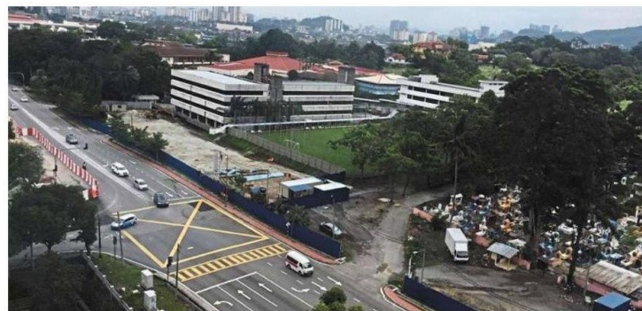
Aerial view of the site of the proposed food court (left, behind blue hoarding) along Jalan Kerja Ayer Lama in Ampang. On the right is the Ampang/Ulu Kelang Hindu Cemetery.

Facility with anaerobic digestion plant to have minimal impact on traffic and environment, assures MPAJ