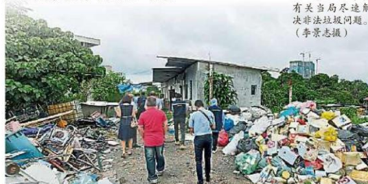
非法回收厂把收回来的固体废物分类,但是处理方式不当。

他透露,只有下大雨,垃圾堆散发恶臭味,严重造成困扰,为了解决有关问题,他再一次作出投诉,直接向州议员反映。他补充,他的要求很简单,希望当局积极处理该非法垃圾问题,禁止再有非法垃圾出现。