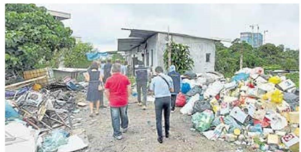
■已运作8年的非法回收厂把回收回来的固体垃圾分类，但是当局发现他们处理不当，涉嫌破坏环境。

(加影27日讯) 霸占水利灌溉局保留地以非法运营回收厂至今8年不曾被对付，固体垃圾处理不当破坏环境及河流，雪州行政议员兼加影州议员许来贤怀疑有市议会官员涉及包庇，并且发出指示要求相关部门进行调查，同时也查封该厂。