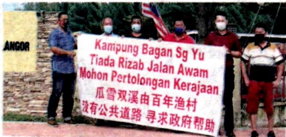
Penduduk berhimpun di Pejabat Daerah dan Tanah Kuala Selangor pada Isnin.

“Rizab jalan ini penting untuk kegunaan penduduk yang berulang-alik menghantar anak ke sekolah dan pelbagai urusan harian lain,” katanya.