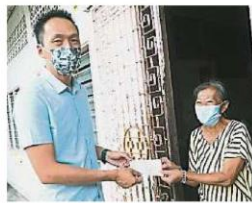
当地居民。

他补充，至于其他的解决方案则需要各单位商讨对策，如是否需加宽沟渠、挖深古腰河道、增设防洪堤等。