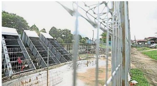
古腰河上的3架抽水机是自动化系统，在星期日(26日)下午时有正常运作。