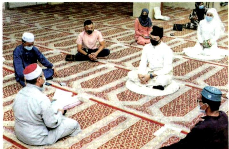
PASANGAN di Selangor yang ingin bernikah sukar untuk mendapatkan slot janji temu permohonan kebenaran perkahwin. – GAMBAR HIASAN