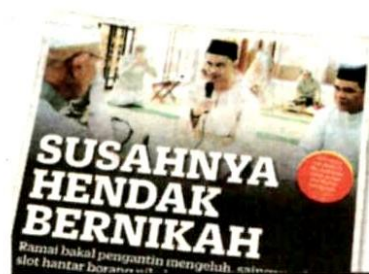
KERATAN Kosmo! 18 September 2021.

lalu melaporkan, hanya 75 slot janji temu bagi permohonan kebenaran perkahwin dibuka ke-